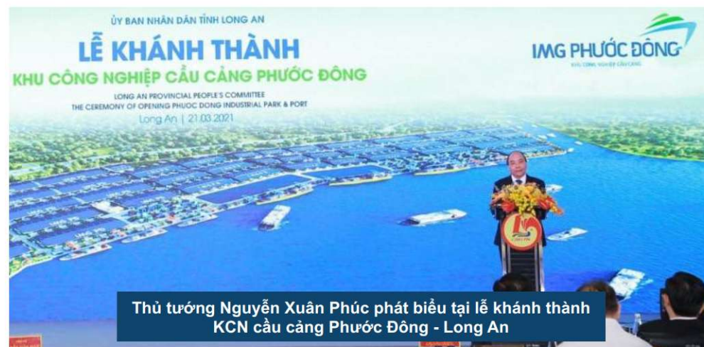
Thủ tướng Nguyễn Xuân Phúc phát biểu tại lễ khánh thành KCN cầu cảng Phước Đông - Long An

Ngày 21/03/2021, thủ tướng Nguyễn Xuân Phúc, phó chủ tịch thường trực Trương Hòa Bình cùng các bộ trưởng đã dự lễ khánh thành khu công nghiệp cầu cảng Phước Đông, được kỳ vọng là một điểm sáng trong thu hút đầu tư tại tỉnh Long An, đóng góp hiệu quả vào phát triển chung của vùng kinh tế trọng điểm phía nam.