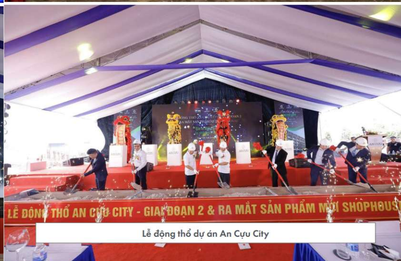
Lễ động thổ dự án An Cựu City