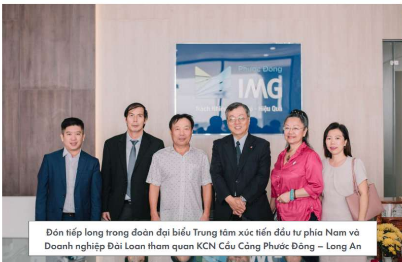
Đón tiếp long trọng đoàn đại biểu Trung tâm xúc tiến đầu tư phía Nam và Doanh nghiệp Đài Loan tham quan KCN Cầu Cảng Phước Đông – Long An