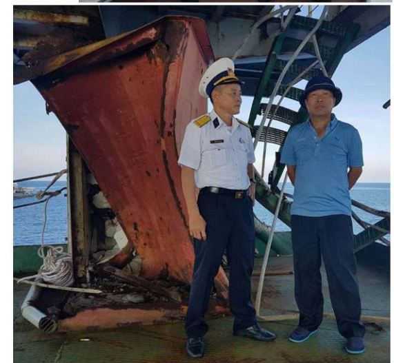
Tài trợ kinh phí thực hiện đề án: "Phát triển y tế biển đảo"