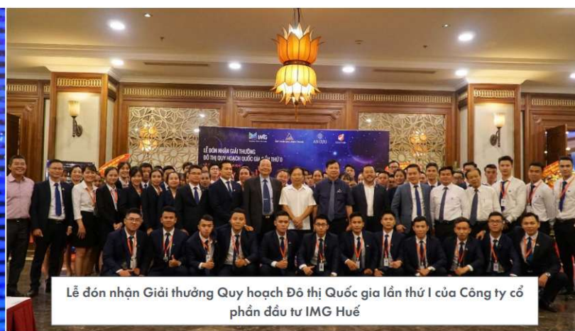
Lễ đón nhận Giải thưởng Quy hoạch Đô thị Quốc gia lần thứ I của Công ty cổ phần đầu tư IMG Huế