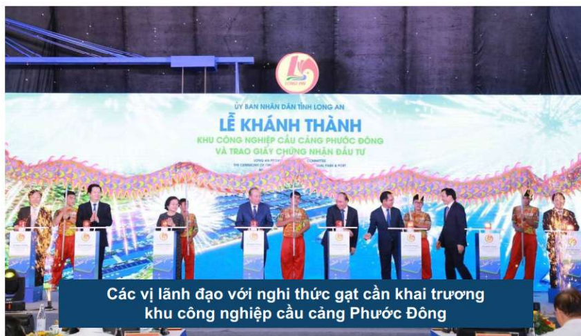
Các vị lãnh đạo với nghi thức gạt cần khai trương khu công nghiệp cầu cảng Phước Đông