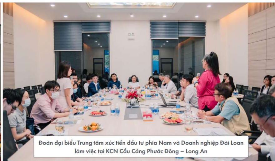
Đoàn đại biểu Trung tâm xúc tiến đầu tư phía Nam và Doanh nghiệp Đài Loan làm việc tại KCN Cầu Cảng Phước Đông – Long An