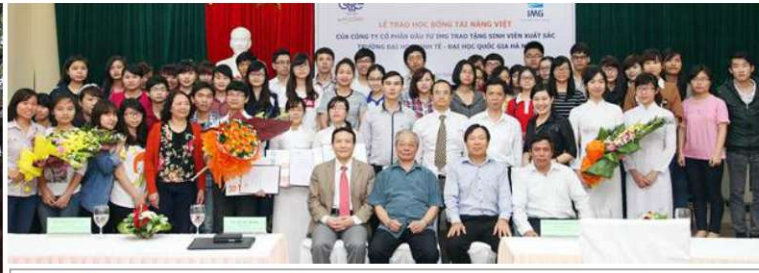
Tài trợ 10 tỷ cho Quỹ Học Bổng Tài Năng Việt – Trường Đại Học Kinh Tế – Đại học Quốc Gia Hà Nội