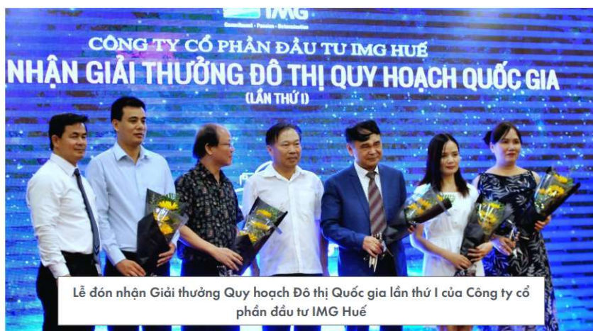
Lễ đón nhận Giải thưởng Quy hoạch Đô thị Quốc gia lần thứ I của Công ty cổ phần đầu tư IMG Huế