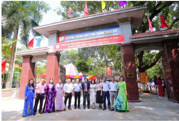
Tài trợ xây dựng cổng trường THPT Bến Tre