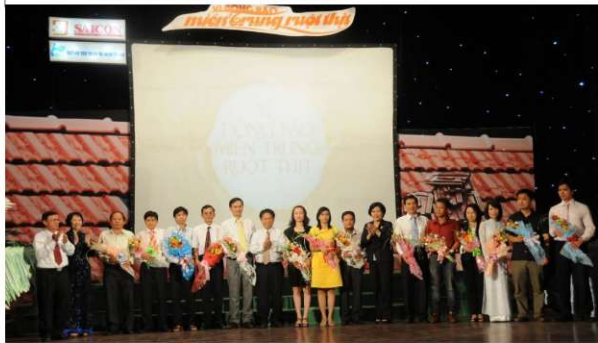
Tài trợ 12 tỷ để xây trường học ở Quảng Nam