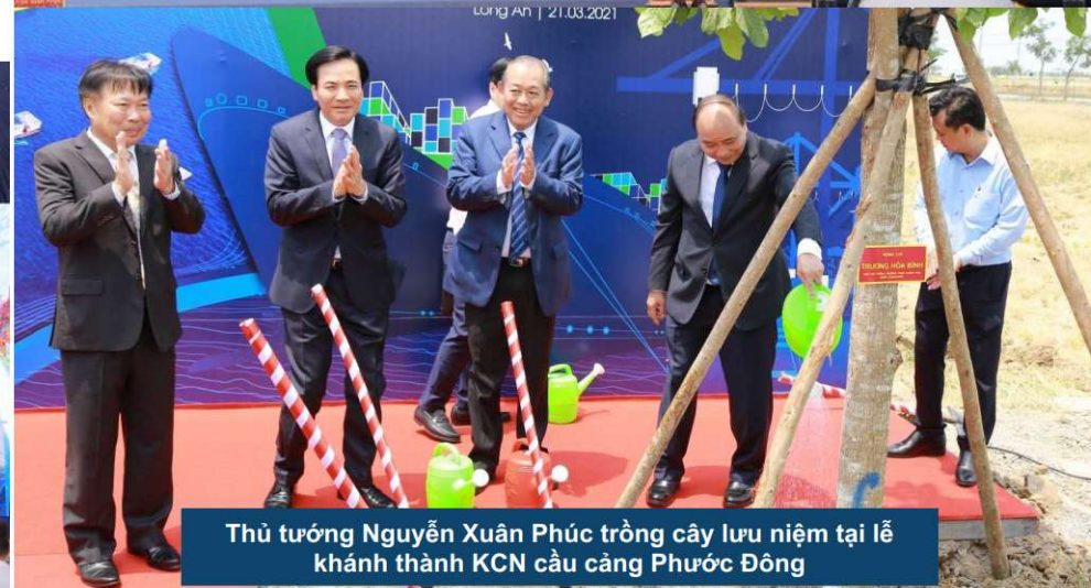
Thủ tướng Nguyễn Xuân Phúc trồng cây lưu niệm tại lễ khánh thành KCN cầu cảng Phước Đông