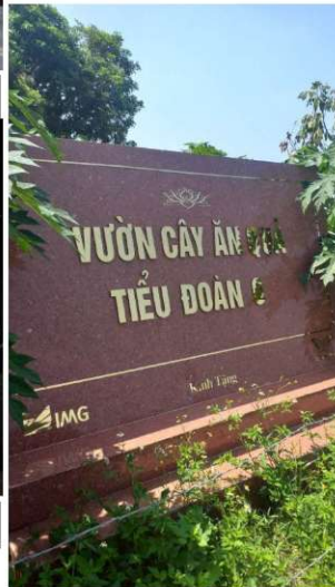
Tài trợ vườn cây ăn trái và bảng biểu tại Học viện Phòng không – Quân đội